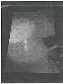
圖說：學生操作色光下塗鴉