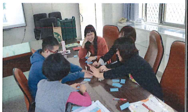
3/7 桌遊融入社會領域教學