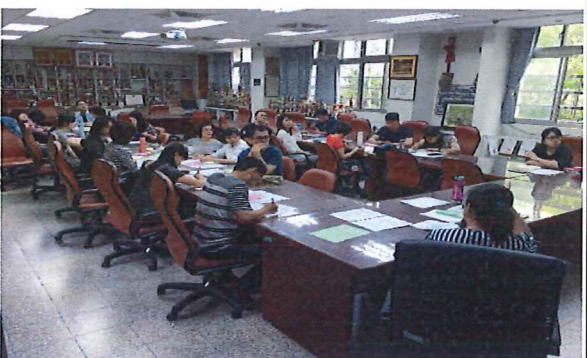
4/11 社會科會考命題設計分享