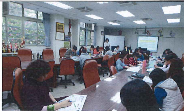
2/21 課程安排規劃與活化教學知能工作坊計畫擬定