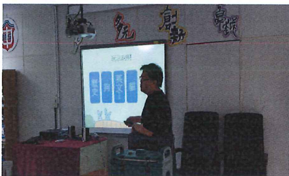
3/7 桌遊融入社會領域教學