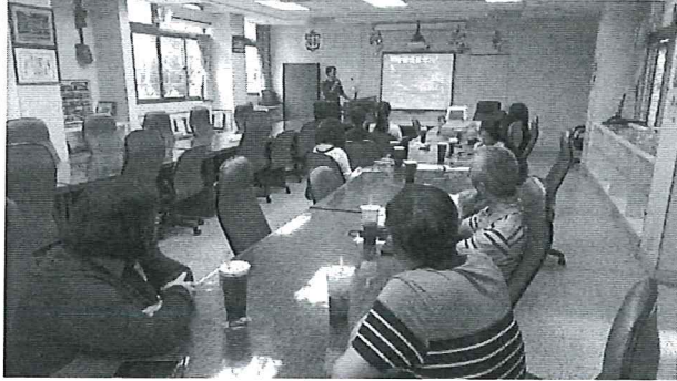
圖說：昆蟲與動物生態解說