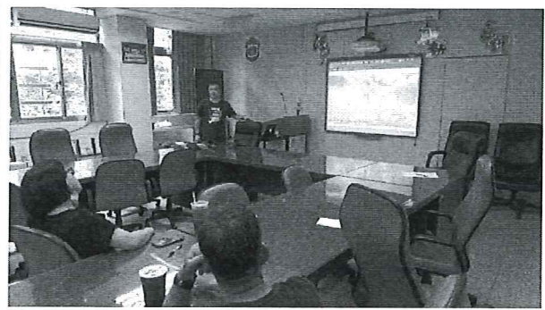
圖說：天文星象探究與故事分享說明會