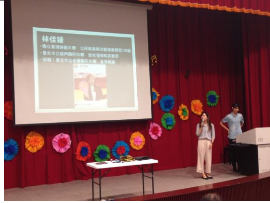
圖說：兩位分享者分享教案