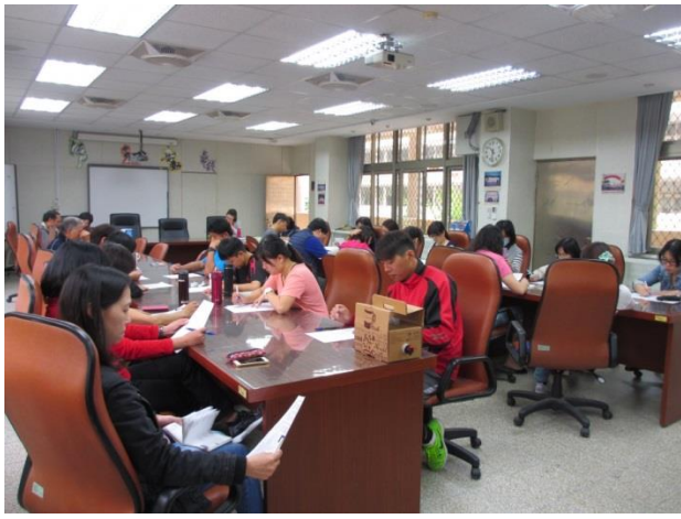
圖說：2017. 04. 06 健康與體育領域第二次教學研究會，進行議課與回饋。