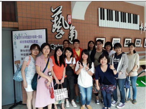
圖說：石牌國中綜合領域老師合照