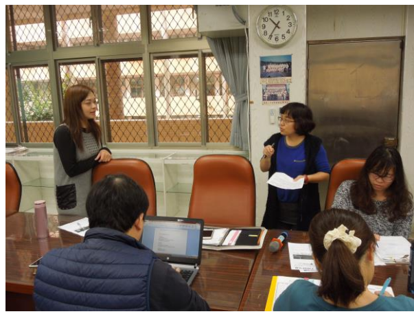
06/22 綜合領域教師群進行學期教學省思與展望