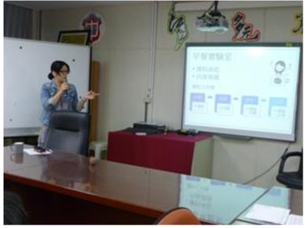
圖說：4/6 分享早餐實驗室課程