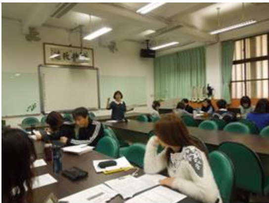
圖說：2/23 領域老師討論行事曆工作規劃