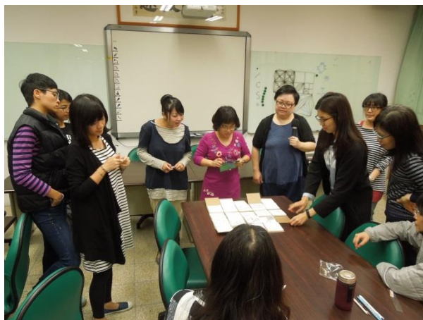
圖說：04/13 老師們彼此觀摩、欣賞作品