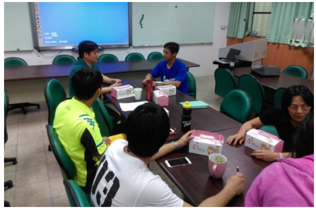
圖說：2017. 04. 20 進行講師與健體領域教師問答與分享討論。