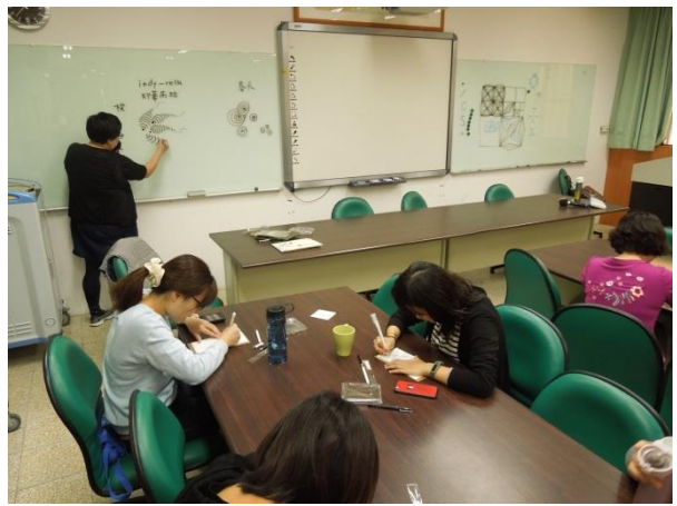
圖說：04/13 講師示範有機圖案 讓老師們臨摹、練習