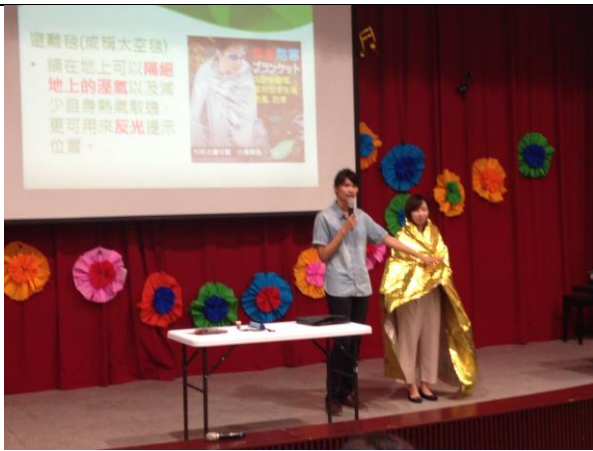
圖說：04/20 北投國中亮點講堂:實物介紹