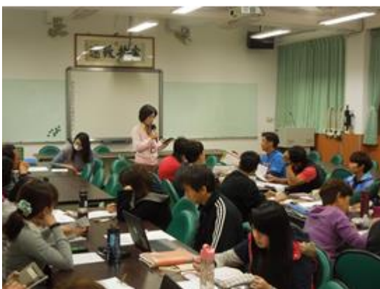
圖說：3/16 世大運主題融入教學說明