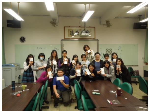
圖說：04/13 老師們開心地展示自己的作品與講師合照