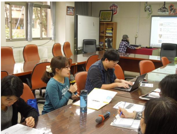
圖說：06/22 討論課程計畫