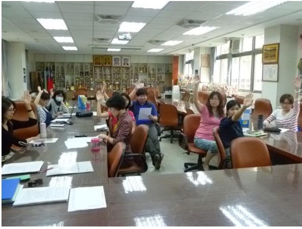
圖說：4/6 選購教科書表決過程