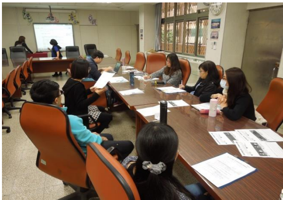
圖說：3/16 教學觀摩 議課