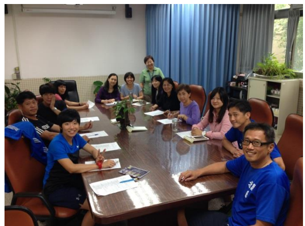
圖說：2017. 06. 22 健體領域教師群進行學期教學省思與未來展望討論