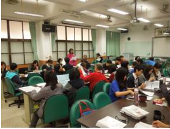
圖說：06/22 領域交流分享