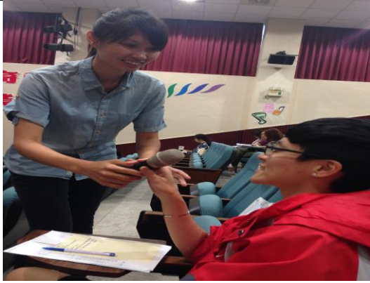
圖說：04/20 北投國中亮點講堂