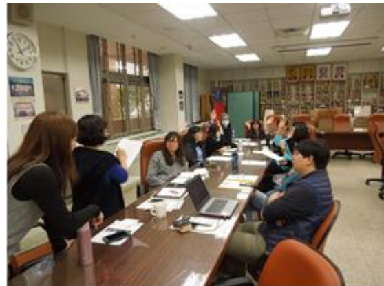
圖說：3/16 教學觀摩 議課