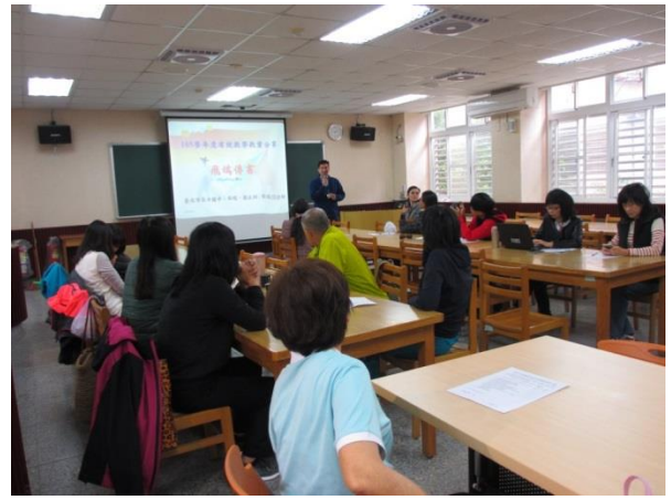
圖說：2017. 04. 13 至北投國中參加 105 學年度第二學期群組學校亮點講堂研習，進行「有效教學教案示例」分享