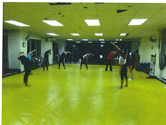
圖說：108/11/28 校內增能研習 暖身運動 講題：【瑜珈入門 1】 講師：仇宜湘老師