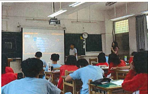
圖說：108/10/3 教學實踐(授課) 壓力歌曲挑戰