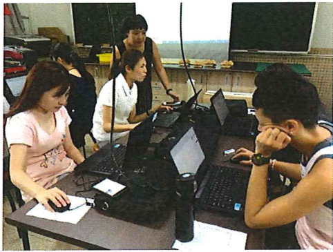
圖說：108/09/19 校內增能研習 貼心的講師隨時下來關心老師們

臺北市石牌國中 108 學年度第 1 學期綜合領域會議照片 時間：108 學年度第 1 學期綜合活動領域時間 地點：石牌國中(學習資源中心)