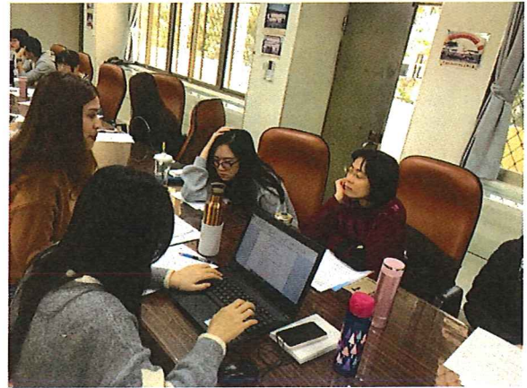
圖說：108/01/09 第四次教學研究會 領域事項討論