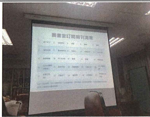
圖說：108/12/05 教學研究會 圖書館期刊說明