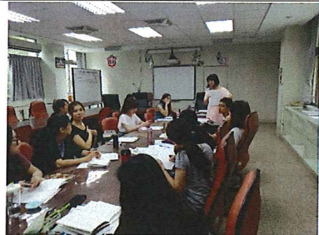
圖說：108/09/05 第一次教學研究會 領召宣布討論事項 領召帶領討論行事曆草案