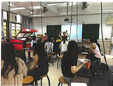
圖說：108/09/19 校內增能研習 講師開場講解掃描與切割的不同