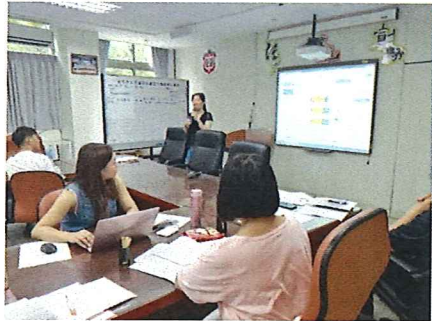
圖說：108/09/05 第一次教學研究會 教務主任報告