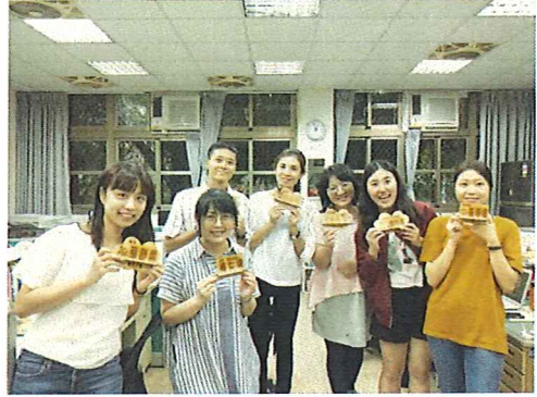
圖說：108/09/19 校內增能研習 完美的成品出爐