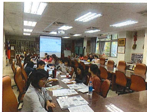
圖說：108/10/17 教學研究會 教學組長宣導相關事項