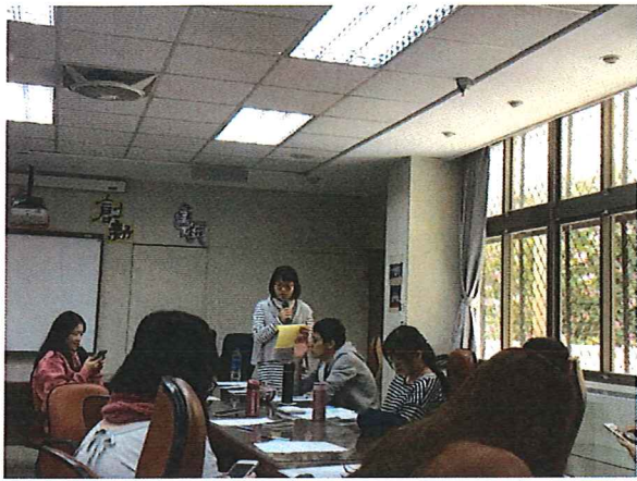
圖說：108/01/09 第四次教學研究會 領招帶領討論期末事項

臺北市石牌國中 108 學年度第 1 學期綜合領域會議照片 時間：108 學年度第 1 學期綜合活動領域時間 地點：石牌國中(校史室)