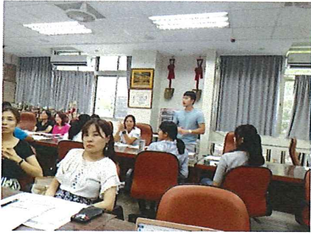
圖說：108/09/05 第一次教學研究會 生教組說明防災相關事宜

臺北市石牌國中 108 學年度第 1 學期綜合領域會議照片 時間：108 學年度第 1 學期綜合活動領域時間 地點：石牌國中（校史室/學習資源中心）