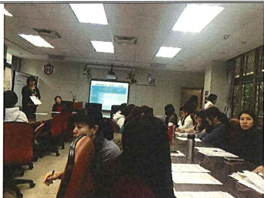
圖說：108/12/05 教學研究會 教學組長宣導