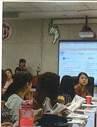
圖說：108/10/17 教學研究會 特教組長宣導相關事項

臺北市石牌國中 108 學年度第 1 學期綜合領域會議照片 時間：108 學年度第 1 學期綜合活動領域時間 地點：石牌國中(校史室)