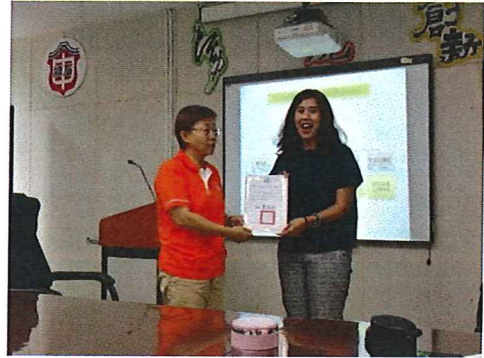
圖說：108/09/05 第一次教學研究會 頒發認輔獎狀