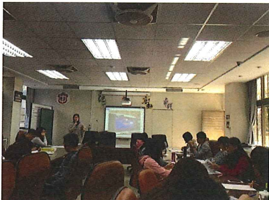
圖說：108/01/09 第四次教學研究會 主席報告與議題討論