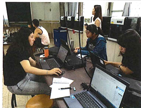
圖說：108/09/19 校內增能研習 老師們設計自己的手機架