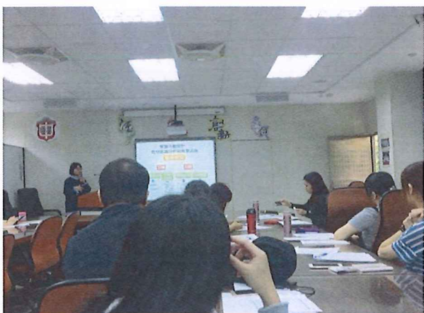
圖說：108/04/11 教學研究會 課程內容說明-分組活動方式