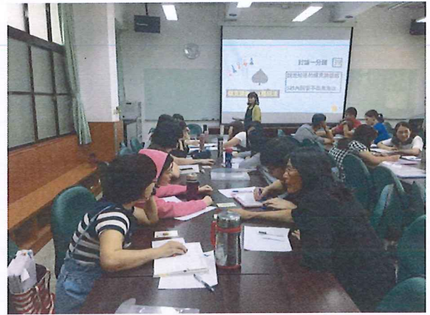
圖說：108/05/30 教學研究會 講師引導老師們討論撲克牌玩法