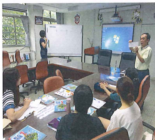
圖說：108/06/13 選書說明會 開票過程與結果