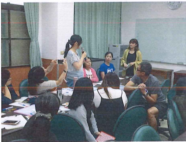
圖說：108/05/30 教學研究會 老師與大家分享自己分組經驗