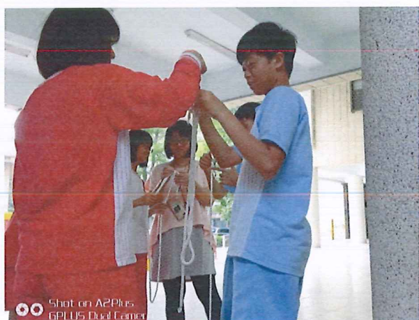
圖說：108/04/18 教學研究會 小隊長投入繩解說明講解