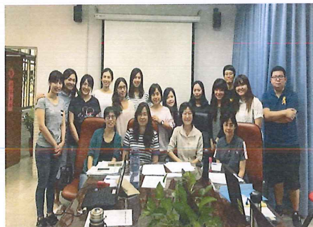
圖說：108/06/13 教學研究會 領域大合照