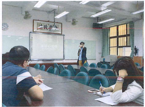
圖說：108/03/21 情感教育增能研習 講師帶領現場大家進行討論