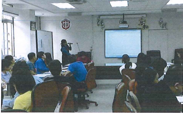
圖說：108/02/21 第一次教學研究會 教學組長進行校務報告

臺北市石牌國中 107 學年度第 2 學期綜合領域會議照片 時間：107 學年度第 2 學期綜合活動領域時間 地點：石牌國中（校史室）