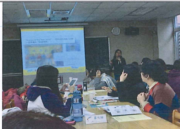
圖說：108/03/07 分區領綱宣導調訓 “France in the Year 2000” 暖身活動