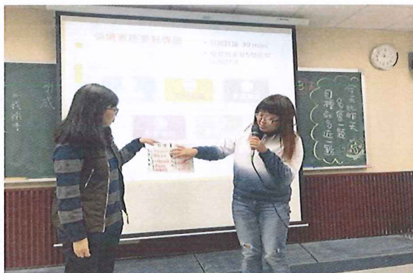
圖說：108/03/07 分區領綱宣導調訓 石牌國中綜合領域教師進行分組導讀