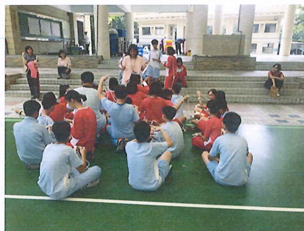
圖說：108/04/18 教學研究會 課程結束前、老師給予各組回饋