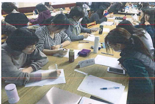
圖說：108/03/07 分區領綱宣導調訓 石牌國中同儕教師進行討論分享