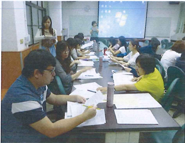
圖說：108/05/23 教學研究會 教學組報告

臺北市石牌國中 107 學年度第 2 學期綜合領域會議照片 時間：107 學年度第 2 學期綜合活動領域時間 地點：石牌國中學習資源中心(圖書館)