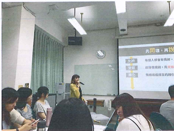
圖說：108/05/30 教學研究會 講師介紹情緒轉化

臺北市石牌國中 107 學年度第 2 學期綜合領域會議照片 時間：107 學年度第 2 學期綜合活動領域時間 地點：石牌國中學習資源中心(圖書館)