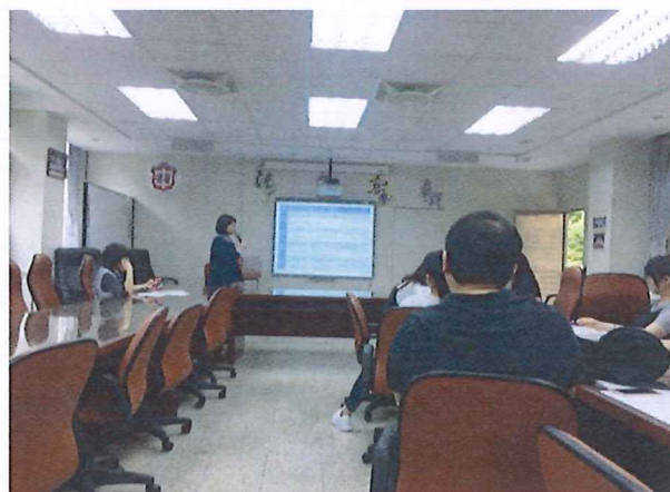
圖說：108/04/11 教學研究會 課程內容說明-組內運作方式