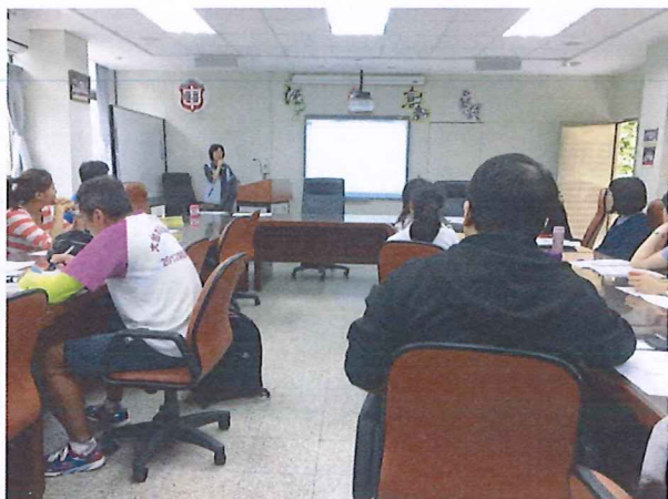
圖說：108/04/11 教學研究會 教務處報告

臺北市石牌國中 107 學年度第 2 學期綜合領域會議照片 時間：107 學年度第 2 學期綜合活動領域時間 地點：石牌國中(校史室)