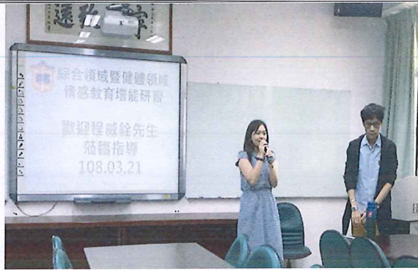
圖說：108/03/21 情感教育增能研習 領召進行開場介紹

臺北市石牌國中 107 學年度第 2 學期綜合領域會議照片 時間：107 學年度第 2 學期綜合活動領域時間 地點：石牌國中學習資源中心(圖書館)