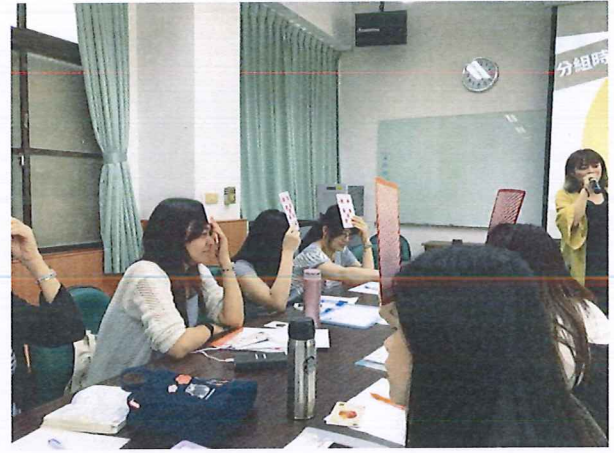
圖說：108/05/30 教學研究會 講師引導老師們進行分組活動