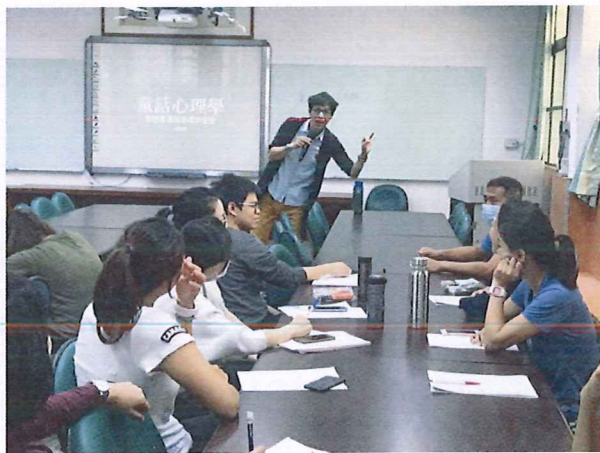
圖說：108/03/21 情感教育增能研習 講師與現場教師互動