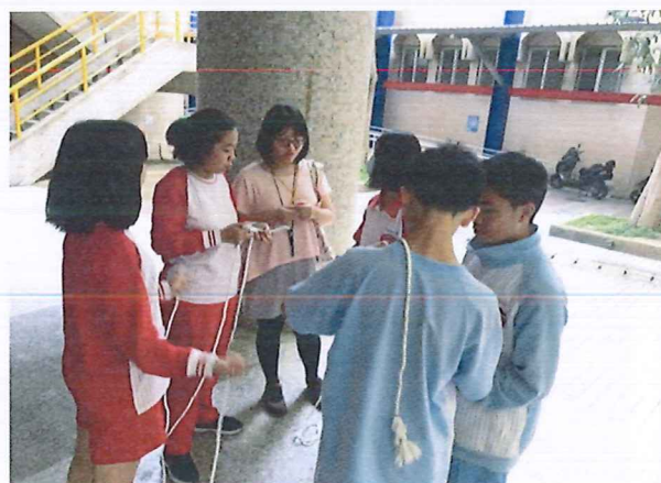
圖說：108/04/18 教學研究會 老師輔助同學完成收繩結