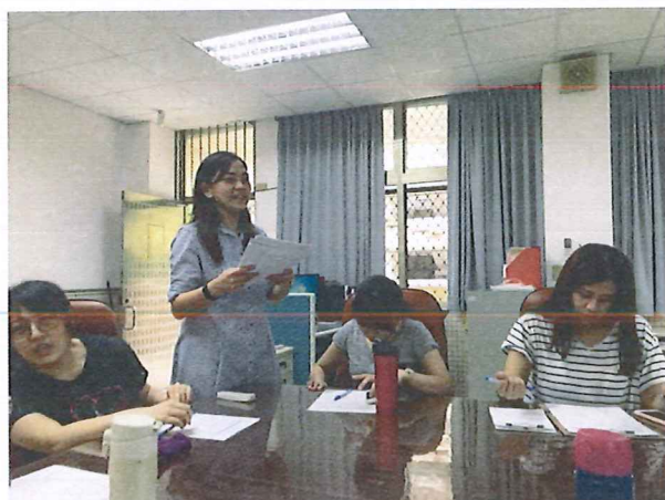
圖說：108/06/13 教學研究會 領域事項報告