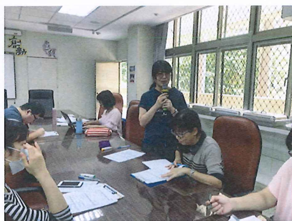
圖說：108/04/18 教學研究會 仁瑞老師給予精彩回饋