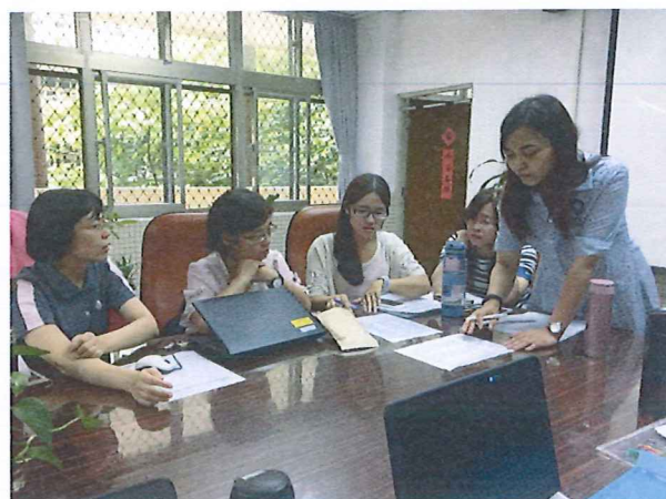
圖說：108/06/13 教學研究會 七年級班級抽籤