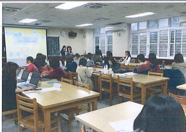
圖說：108/03/07 分區領綱宣導調訓 北投國中校長開場致詞

臺北市石牌國中 107 學年度第 2 學期綜合領域會議照片 時間：107 學年度第 2 學期綜合活動領域時間 地點：北投國中(圖書館)