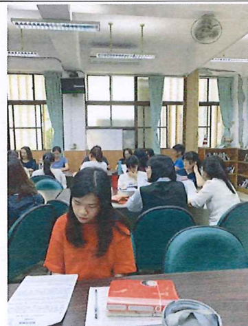
圖說：108/03/21 情感教育增能研習 現場教師進行故事閱讀