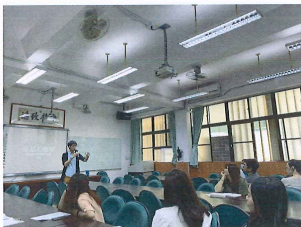
圖說：108/03/21 情感教育增能研習 講師進行案例分享