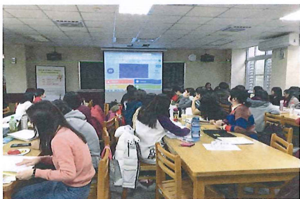
圖說：108/03/07 分區領綱宣導調訓 Kahoot 互動活動