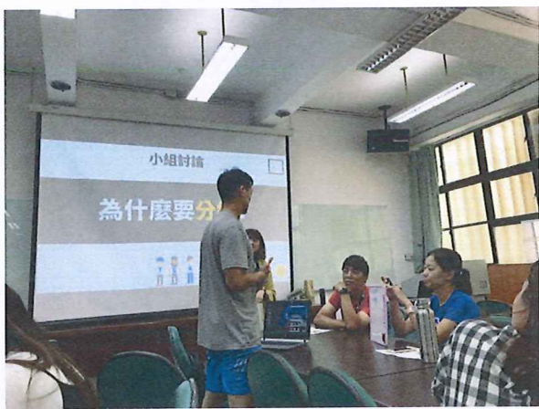
圖說：108/05/30 教學研究會 小組討論-為什麼要分組