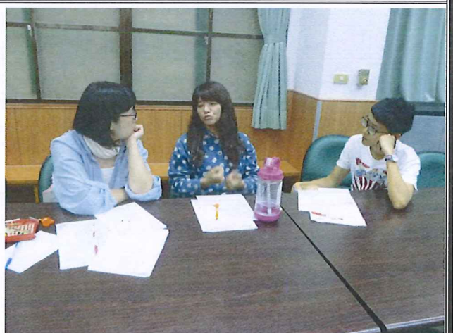
圖說：108/05/23 教學研究會 分科討論 2