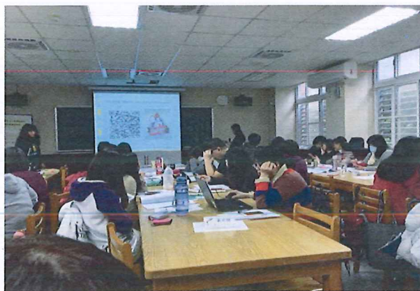
圖說：108/03/07 分區領綱宣導調訓 Holiyo 密室脫逃解密