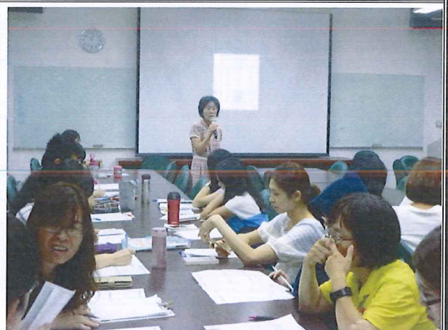
圖說：108/05/23 教學研究會 教務主任報告 2