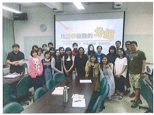
圖說：108/05/30 教學研究會 領域老師與講師的合影