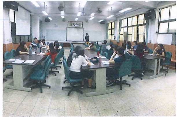
圖說：108/03/21 情感教育增能研習 講師進行舉例說明