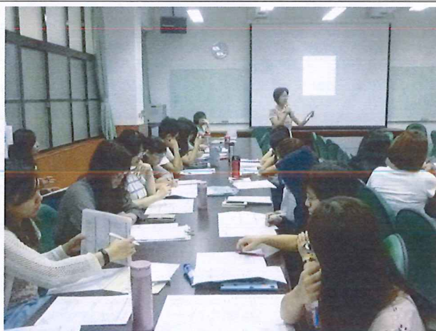
圖說：108/05/23 教學研究會 教務主任報告 1