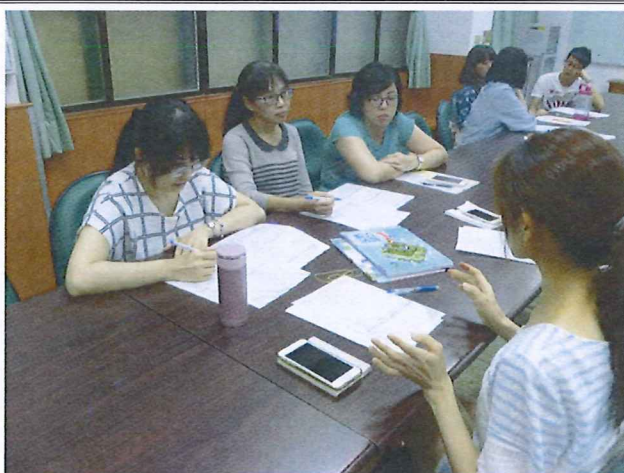
圖說：108/05/23 教學研究會 分科討論 1