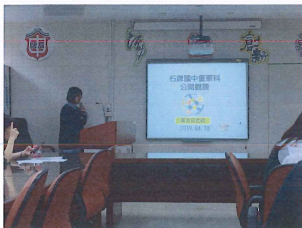
圖說：108/04/11 教學研究會 黃歆茹老師領域公開觀課-備課-教學研討