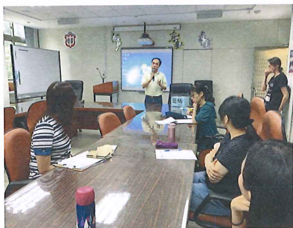
圖說：108/06/13 選書說明會 設備組長說明教科書出版社票選流程