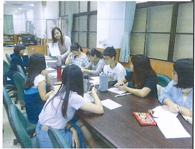
圖說：108/05/23 教學研究會 主席報告與議題討論