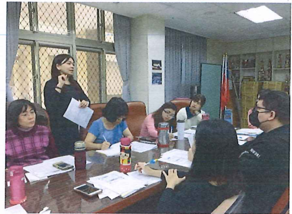
圖說：108/02/21 第一次教學研究會 綜合領召帶領輔導科討論事務