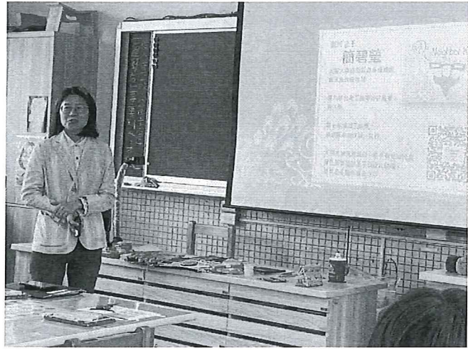
• 2020. 03. 31 「細細織、密密縫」-編織藝術研習