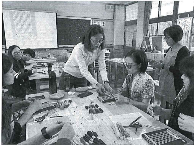
• 2020. 03. 31 「細細織、密密縫」-編織藝術研習