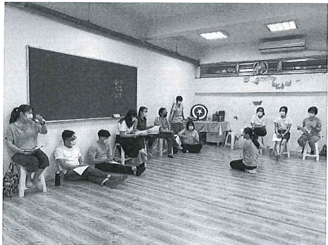
• 2020.05.05 領域共學公開觀課-議課