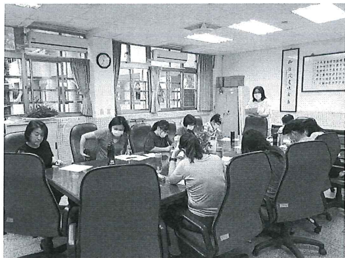
• 2020.05.19 「面對七八年級之亂飛天使」