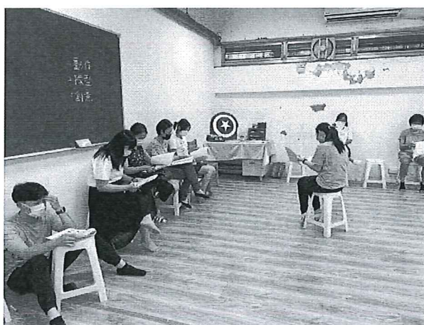
• 2020.05.05 領域共學公開觀課-說課