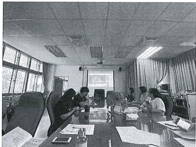
• 2020.06.16 「偶戲歷史與製作」研習分享