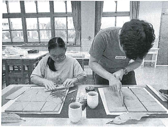
• 2020.06.02 「陶板之美」藝術研習