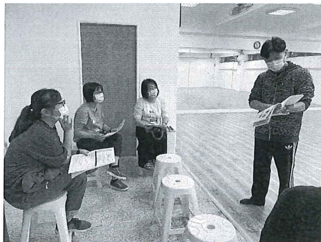
• 2020.04.28 領域共學公開觀課-說課