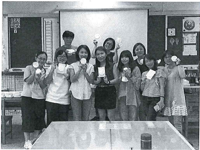
• 2020.06.02 「陶板之美」藝術研習