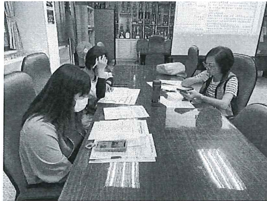
• 2020.04.14 成績評量分享討論