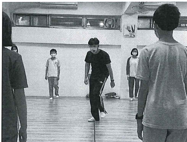
• 2020.04.28 領域共學公開觀課-觀課