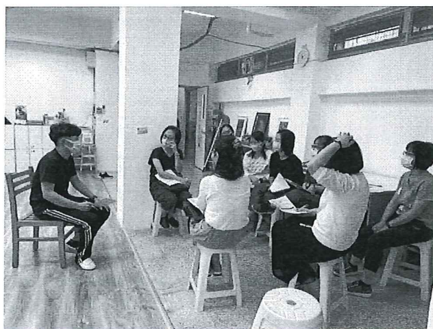
• 2020.04.28 領域共學公開觀課-議課