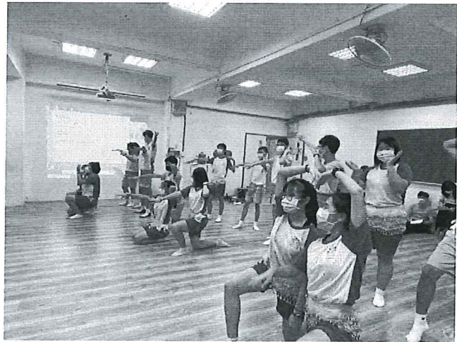
• 2020.05.05 領域共學公開觀課-觀課