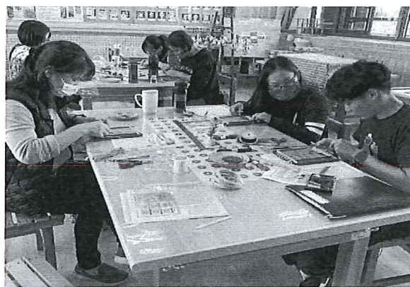
• 2020. 03. 31 「細細織、密密縫」-編織藝術研習