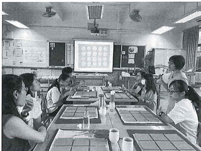
• 2020.06.02 「陶板之美」藝術研習