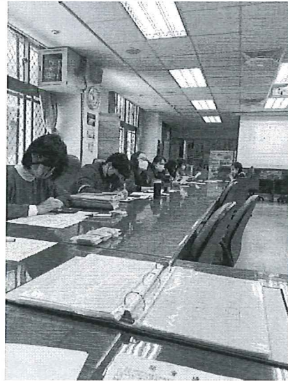
• 2020.04.14 成績評量分享討論