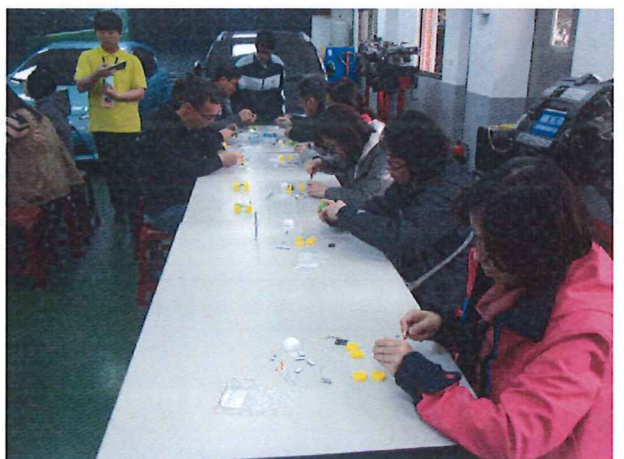
圖說：03/21 太陽能車動手製作