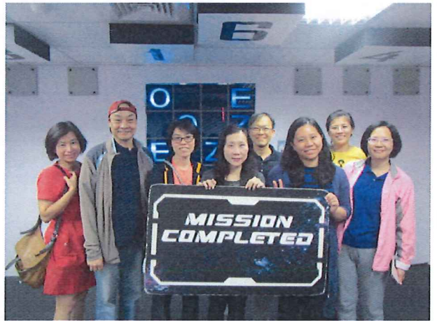
圖說：03/14 密數解謎尋寶記