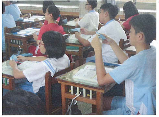
圖說：05/23 公開觀課—學生實作