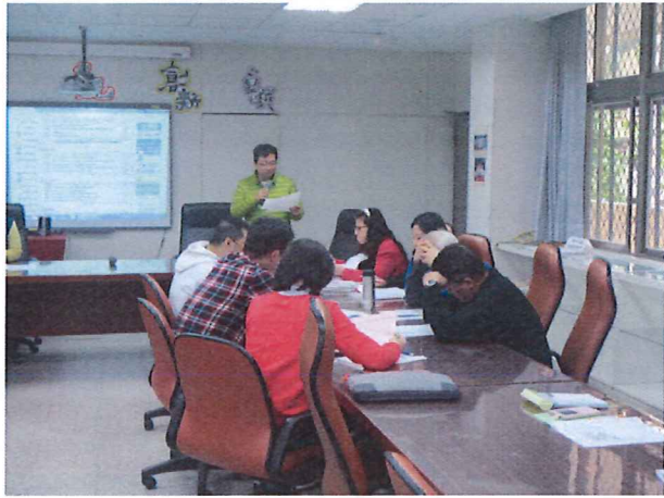
圖說：02/21 課程安排規劃與工作坊計畫擬定