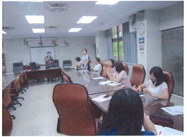
圖說：06/20 遴選 107 學年領召