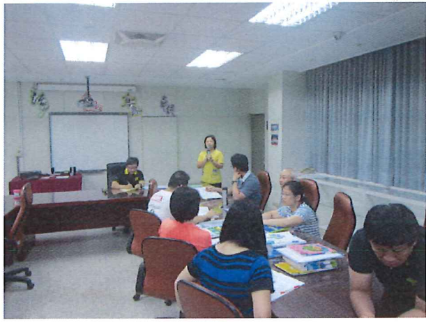
圖說：05/23 公開觀課—說課