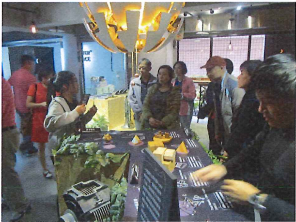
圖說：03/14 密數解謎尋寶記