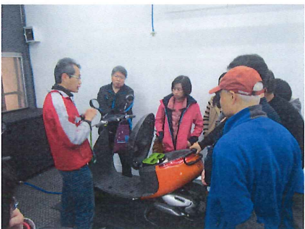
圖說：03/21 電動車原理解說