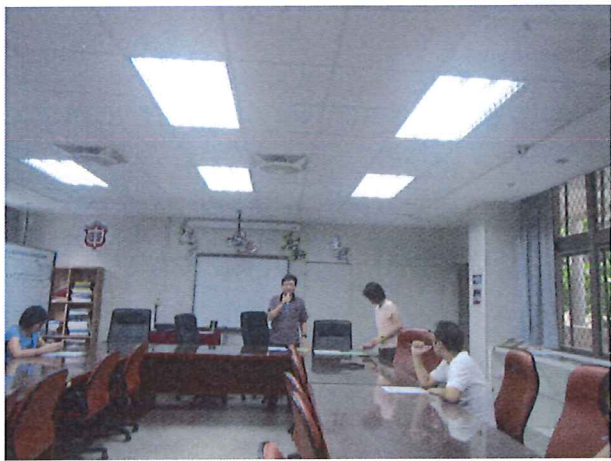
圖說：06/20 期末分享與檢討