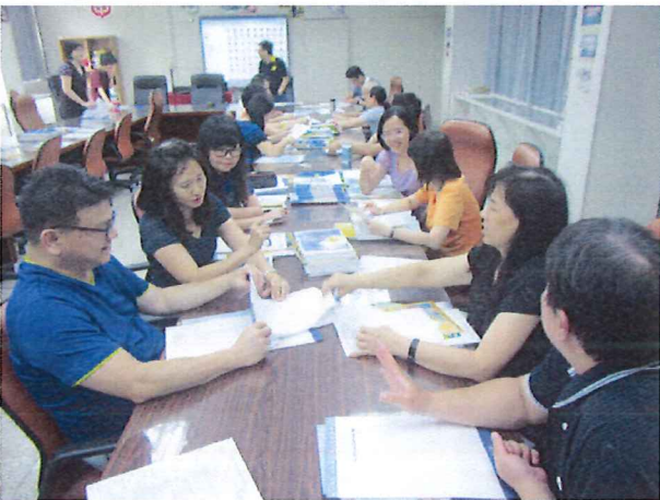
圖說：05/16 第二次定考試題分析與討論