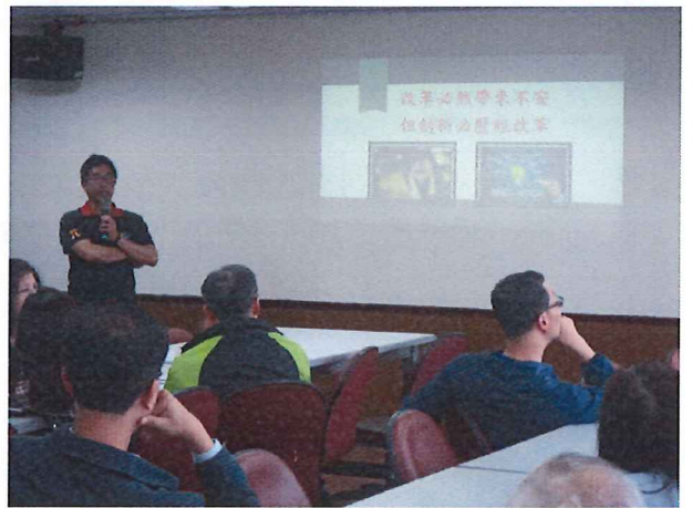
圖說：04/18 素養導向教學示例分享