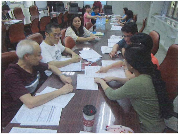
圖說：04/11 第一次定考試題分析與討論