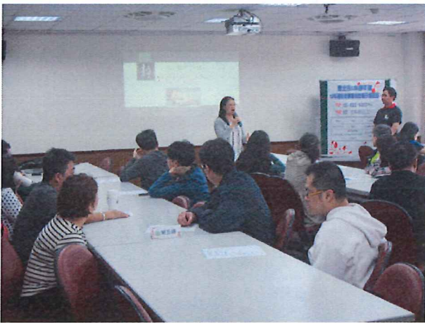
圖說：04/18 十二年國教領綱宣導