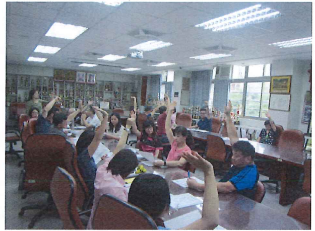
圖說：04/11 第二次教學研究會